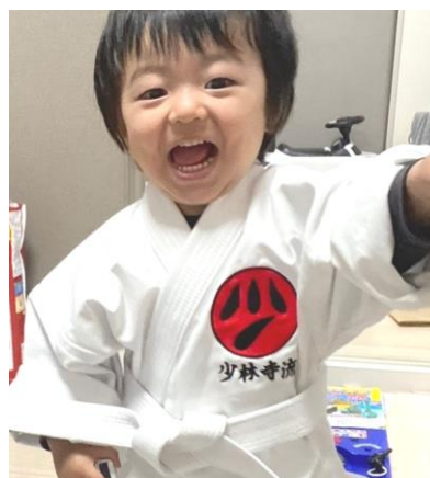
最年少2歳の道友、T君。