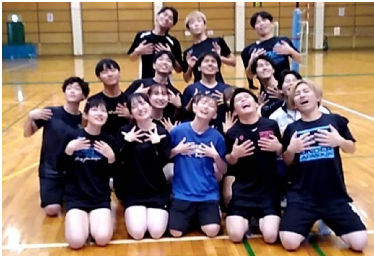
初参加の「都市学園大学」チーム