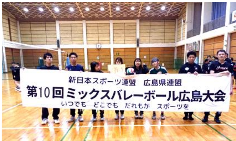
優勝の Gland Joker 広島(グランジョーカー広島)チーム